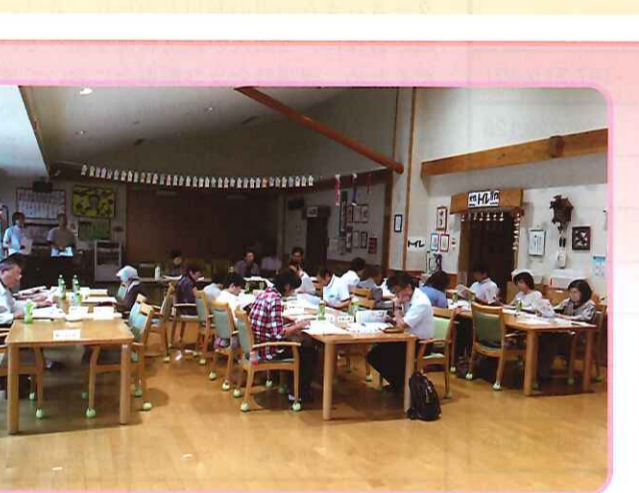
平成28年度 第1回 家族会 平成28年6月5日(日) 13:30~ 平成27年度 事業報告・決算報告・監査報告 平成28年度 事業計画・予算書・運営方針説明学習会 参加ありがとうございました。

施設の無事を確認し、帰宅した。四月十六日 本震。余震のたびにガス管の元栓が閉り大変困っていましたが、とうとう