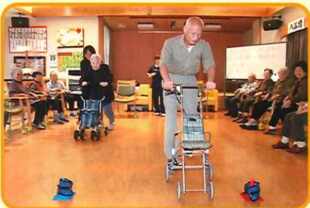
歩行器競争 ~よーいドン~