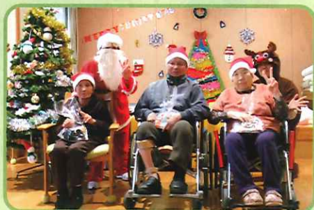
サンタさんプレゼントありがとう♥