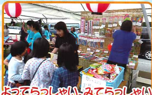
よつてらっしゃい。みてらっしゃい。