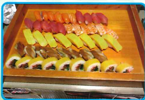
今日はなんの日?お寿司の日