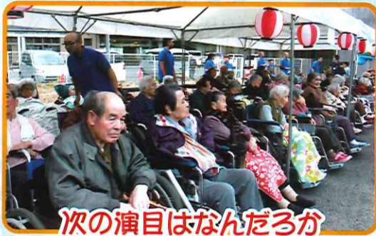
次の演目はなんだるか