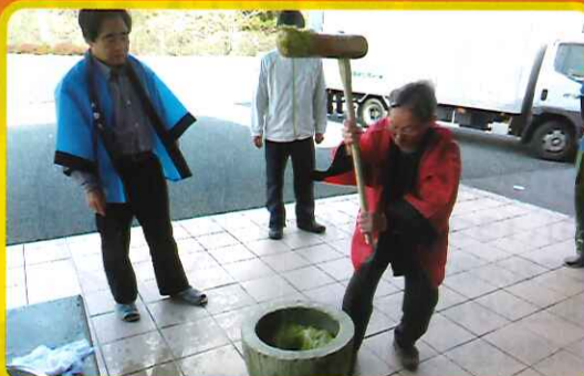
ぼた餅のためなら～