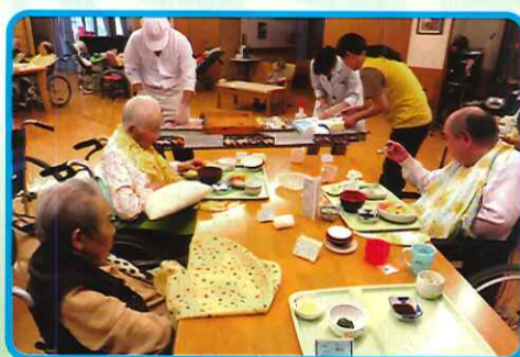
大将!!トロ 私にはたまご