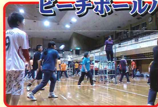
職員親善ビーチボールバレー大会に参加しました。結果は...