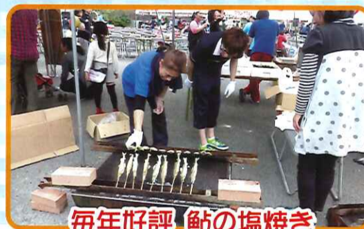
毎年好評 鮎の塩焼き