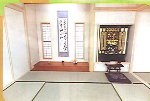
落ち着いた居心地