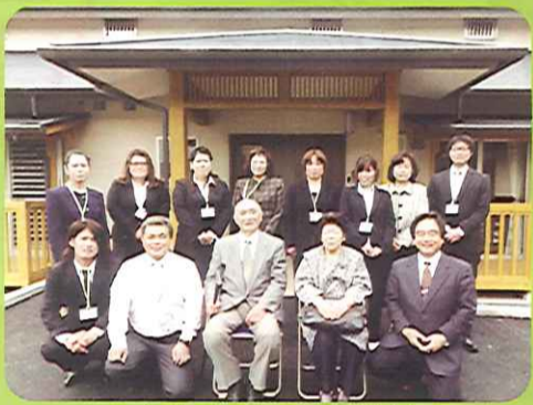
しあわせの里 職員