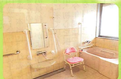
のんびりとしたひと時