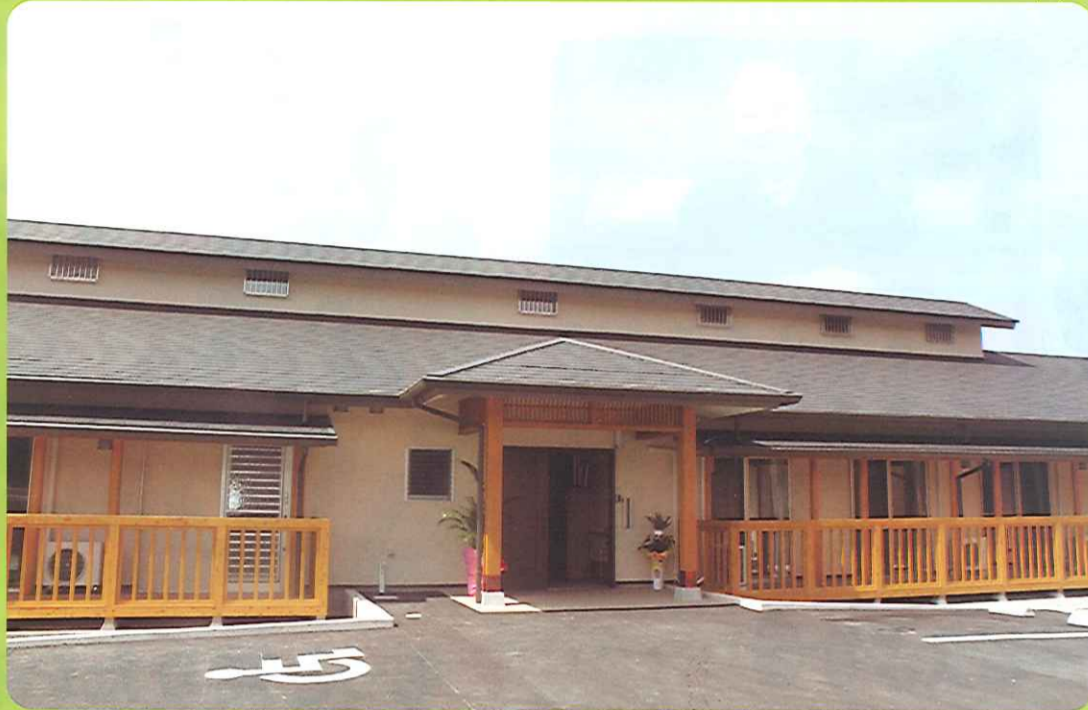
地域交流スペースを兼ね備えたグループホーム完成!!