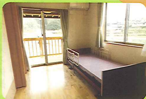
ゆったりとした空間