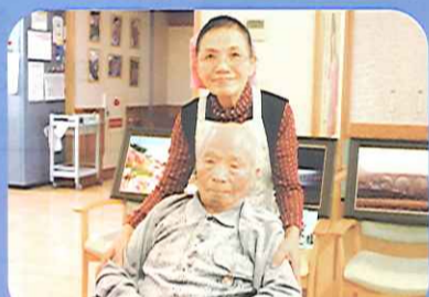
今年もよろしくお願ひします。