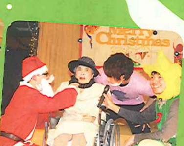
久しぶりにいい気分になったわ!