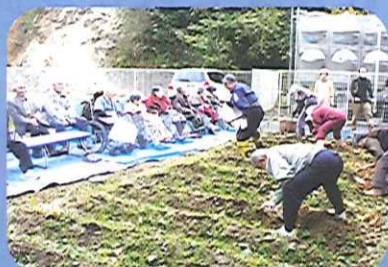
みなさん、芋掘りに夢中です。