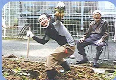
大きなお芋!とれたよ~