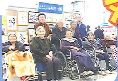
いい文化祭だったね、みんな!