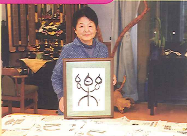
▲篆書体で書かれた「楽」という文字です。 てんしよ