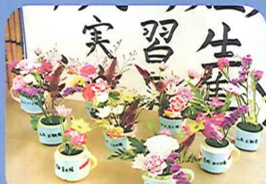
一灯苑文化祭へようこそ。