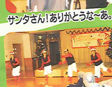
こね太郎、こね次郎、 こね三郎、こね四郎です。