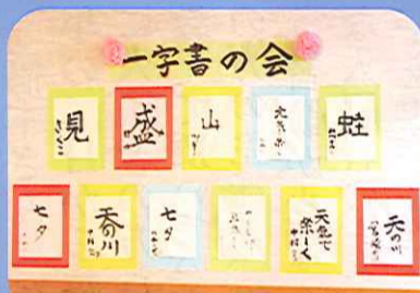
一字書の会・作品展