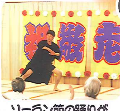
ソーラン節の踊りがさえてました。