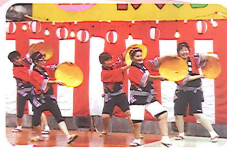
なでしこも盛り上げるわよ!!