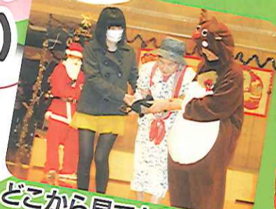
どこから見ても美人よ!