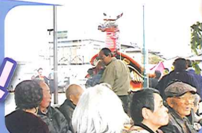
たまには、妙見さんもいいね。