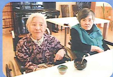
ぜんざい、おいしかったね。