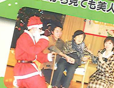
母をよろしくお願ひします。