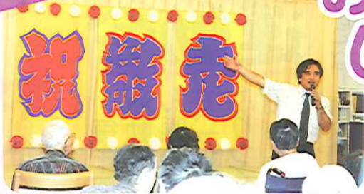
祝・敬老 おめでとうございます。