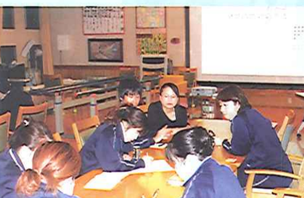
▲虐待防止法ってよくわかるネ!

今回の研修に 参加したことに より、今後の支 援を行っていく うえでは必要不 欠である知識を 少しでも身につ けることが出来 たのではないか と思います。