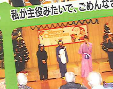
マツケンサンバで頑張りました。