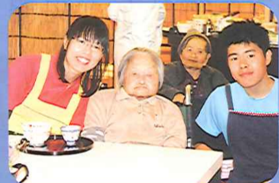
美味しいお茶を召し上がれ。