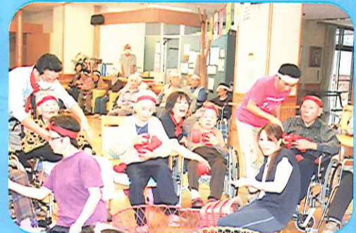
「投げるばい。ソーレー」 なかなか、とどかんあ...