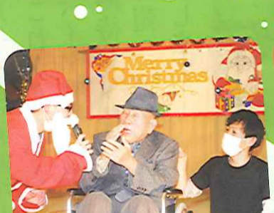
サンタさん!ありがとうな~あ。