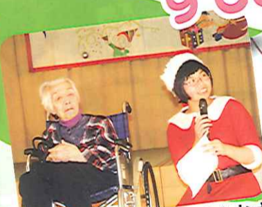
私が主役みたいで、ごめんなさい。