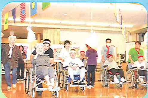
毎年恒例の「パン食い競争」 頑張るばい!!