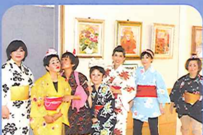
どこにでも登場するなでしこ軍団!