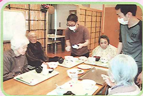
どれも、おいそうですネ。

三月三日(土) 春を先取りして、食事会を開催しました。一階、二階のそれぞれのフロアーはテーブルが並べられ、久しぶりの宴会場に早変わりしました。「こん散らし寿司は、うまかな〜」おいしいそうに食べられる入居者の方の笑顔に、職員も日頃の忙しさを忘れ、楽しいひとときを過ごすことが出来ました。待ちに待った、うららかな春の訪れを感じた一日でした。