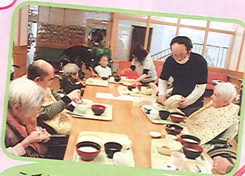
うでによりをかけました。