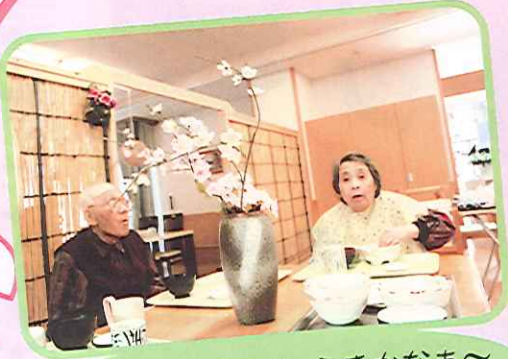
こん散らし寿司は、うまかなあ〜