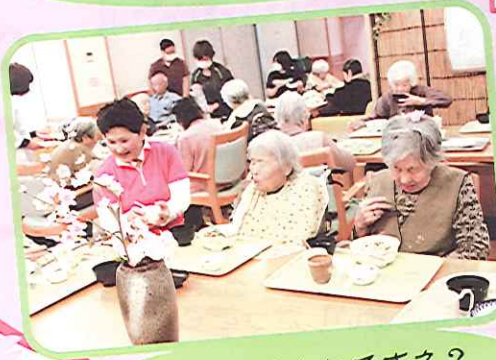
私も花もきれいでスネ?