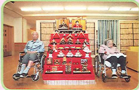
どうだいよく似合っているだろうが。