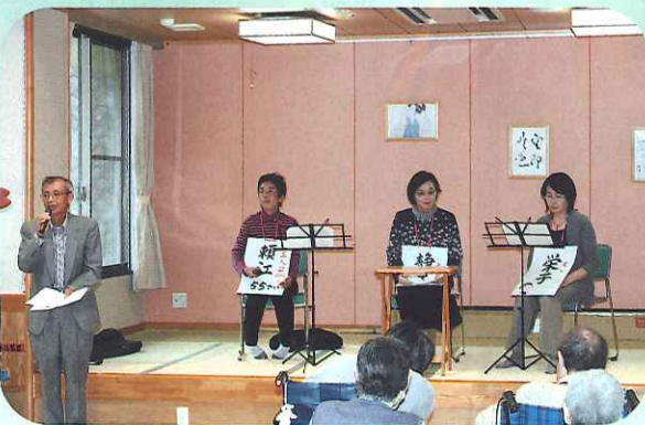
朗読劇の はじまり はじまり！