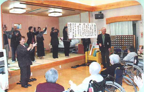
みなさん！ 一緒に歌って 下さいネ

一灯苑デ イサービスにて 人権擁護の啓発と理 解の為に、人権擁護委員 さん達による歌や朗読劇 が行われました。なつか しい歌やユーモラスな朗 読劇に参加者の皆さん、 終始笑顔で見入ってお られました。人権擁護委員 の皆さん、ありがとうございました。