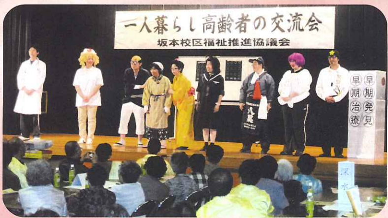
▲うちのおよねをよろしくたのみます。

昨年の十月二十一日に坂本公民館にて「一人暮らし高齢者の交流会」の中で、認知症サポートター養成講座が開催されました。認知症劇を通して、認知症の方に対する「やさしい言葉かけや話しに耳を傾ける」ことの大切さを訴えました。当日は雨でしたが、認知症劇は包括みなみの皆さんと一灯苑職員により、笑いあり涙ありの感動で幕を閉じる事ができました。これからも地域に根ざした活動を行って参ります。暖かく見守って下さい。